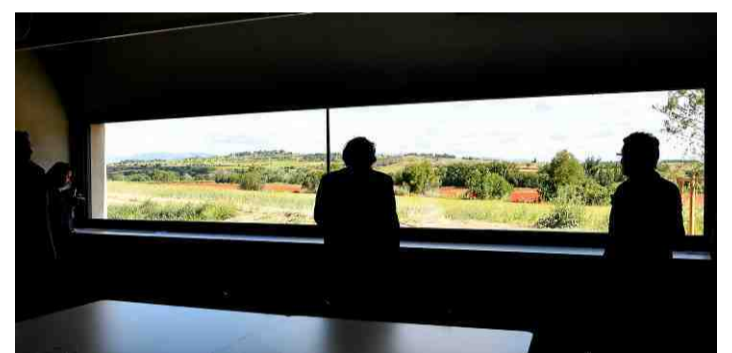
■ La salle de réunion bénéficie d'une vue... inspirante !