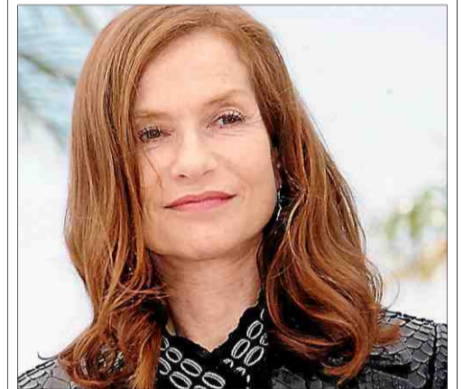
■ Seule sur scène à Montpellier le 19 juin. E.C.

Sade, Cannes... les confidences d'Isabelle Huppert