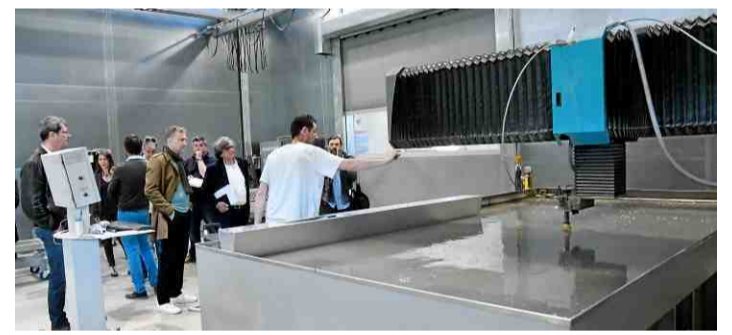
■ Savoir-faire avec ce poste de découpe à l'eau.