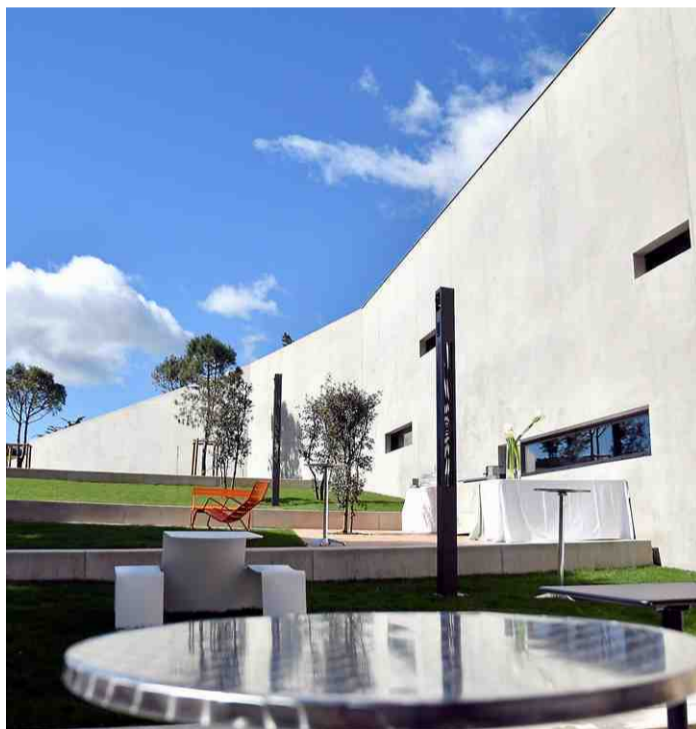
■ La paroi s'élève en douceur. Elle abrite aussi l'espace détente.