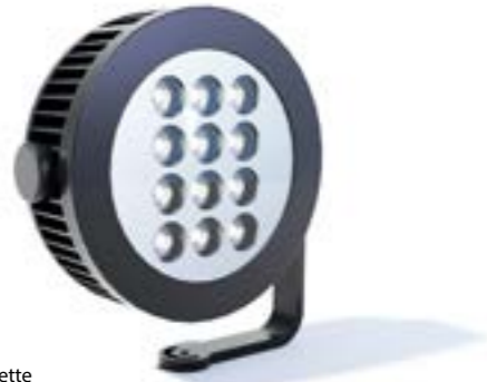
Modèle / model: Paulette