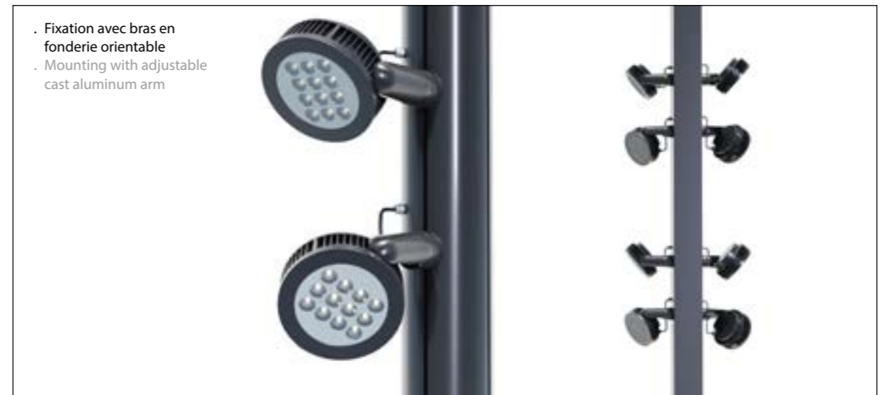
. Fixation avec bras en fonderie orientable . Mounting with adjustable cast aluminum arm