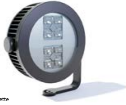
Modèle / model: Paulette XL routier / street