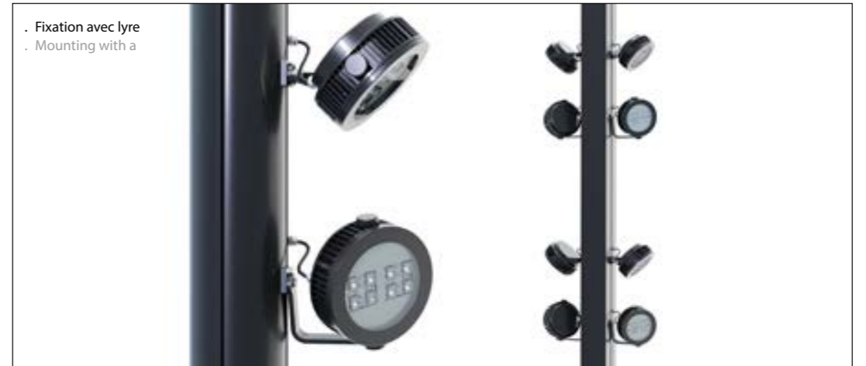
. Fixation avec lyre . Mounting with a

Autres photométries sur demande Other photometrics upon request