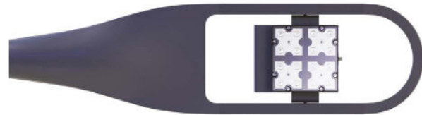
Compatible avec / with 1-2 module(s)