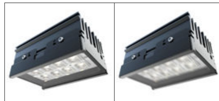
Coupe flux / Flow cut